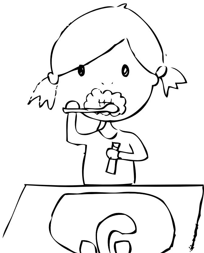
SE BROSSER LES DENTS SE DEBARBOILLER